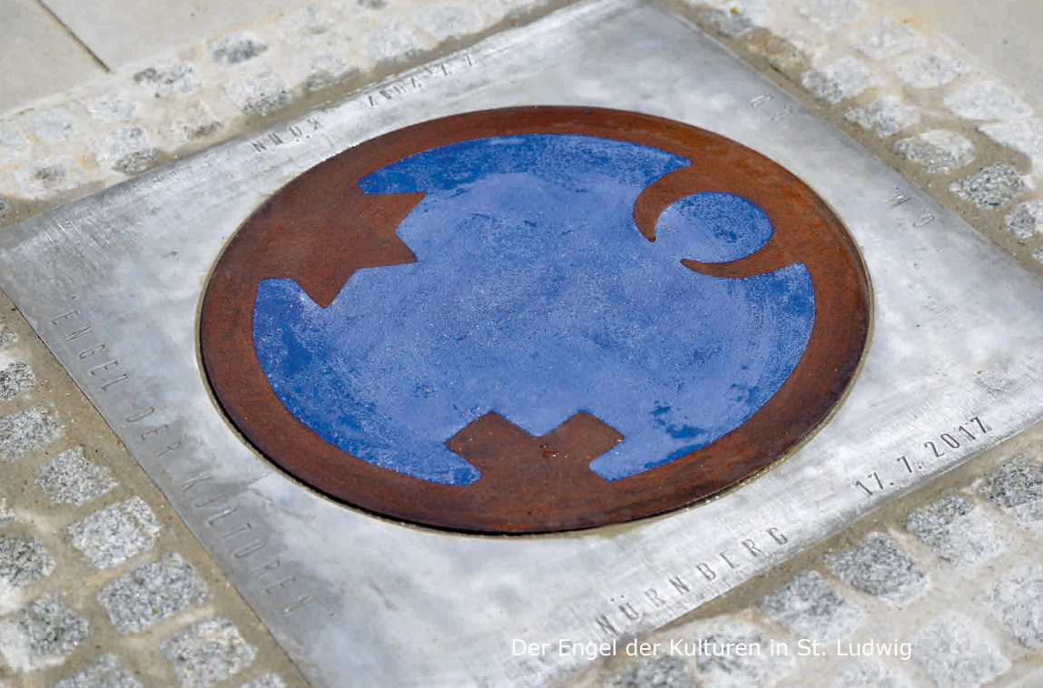
Der Engel der Kulturen in St. Ludwig